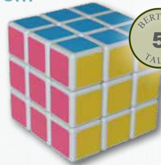
Zauberwürfel 5,5 cm