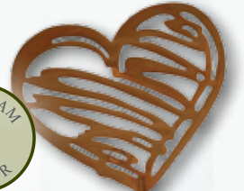
Metall-Gartenstecker Herz, je