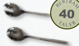
WMF Salatbesteck, 2tlg. Nuova