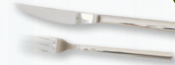
WMF Steakbesteck, 2tlg. Nuova