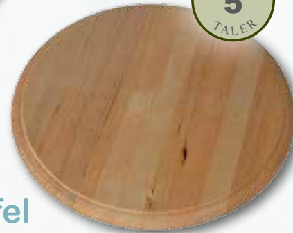
Holzbrett 23 cm