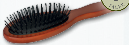
Haarbürste aus Holz, 22 cm