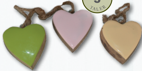
Holzanhänger Herz je Stück

Weitere Prämien in unseren Apotheken und unter www.bertram-taler.de . Schauen Sie herein!