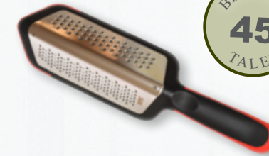
SILIT 2in1 Reibe Grate Cut