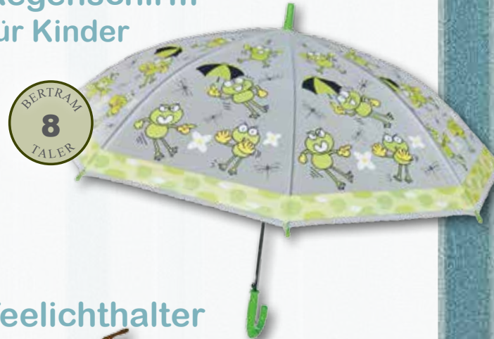
Regenschirm für Kinder